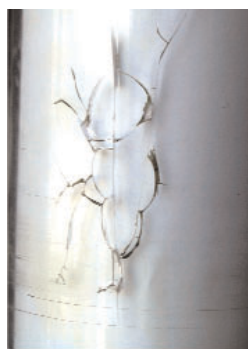
Haarrisse entstehen z.B. durch chemische Reinigungsmittel