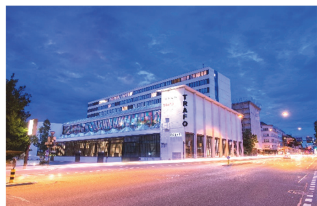
TRAFO Baden

Formazione ed eventi Grütlistrasse 44, casella postale 8027 Zurigo Tel. +41 44 288 33 33 m.mathys@svgw.ch