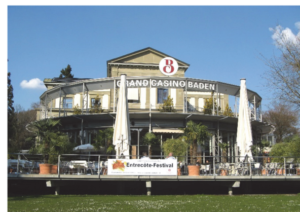
Grand Casino Baden