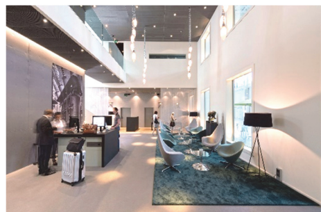
TRAFO Hôtel

Vi preghiamo di prenotare la vostra camera in tempo utile direttamente presso l'hotel di vostra scelta. TRAFO ha un proprio hotel dal fascino industriale urbano.