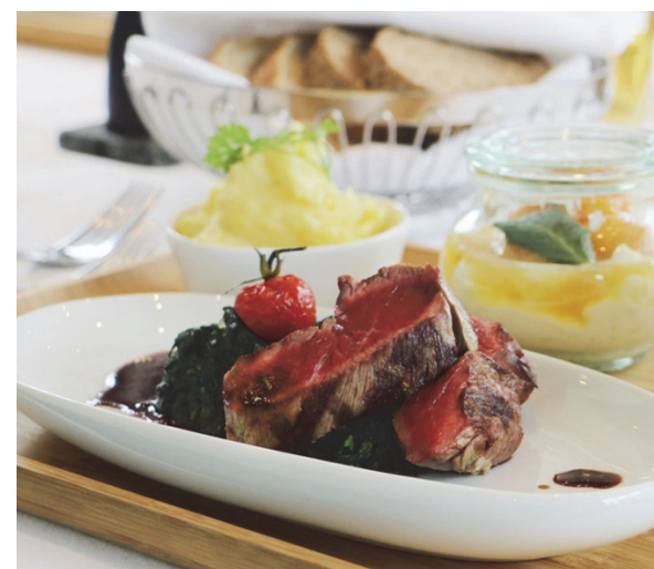
Cena al ristorante PLÜ

Immagine copertina: Città vecchia di Baden con ponte di legno sulla Limmat