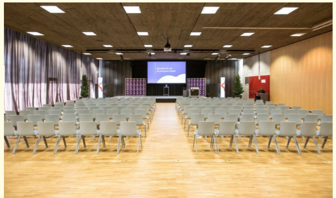
Olma Halle 9.2 D