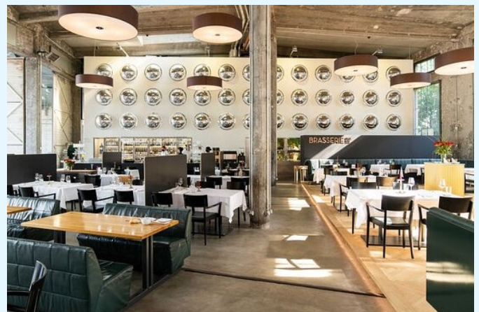
Brasserie Chez Lok