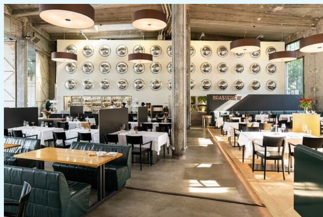
Brasserie Chez Lok

CHF 130.– per soci e non soci più IVA 8,1%