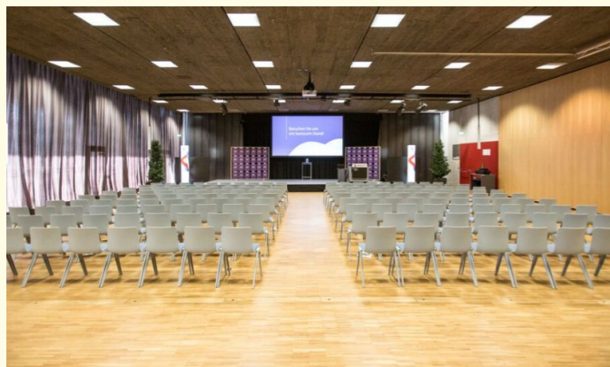
Olma Halle 9.2 D