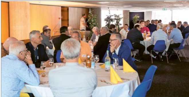
Das gemeinsame Mittagessen mit den Mitgliedern.