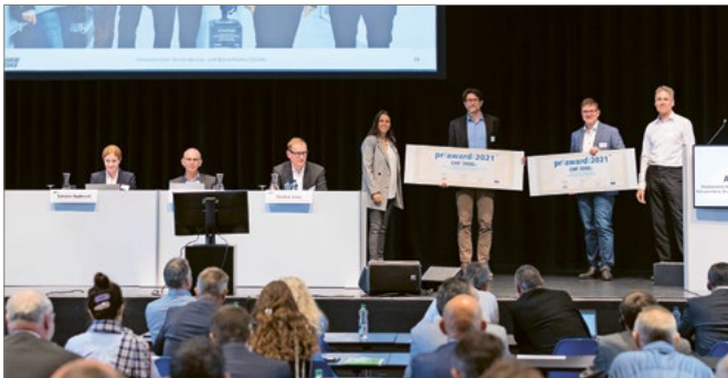
Preisverleihung des PR-Awards 2021.