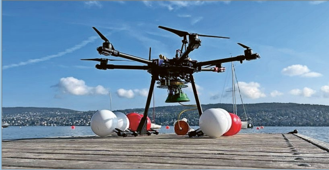
Die Drohne ist bereit für ihren Testflug am Zürichsee

Die Drohne hat erfolgreich das Wasser auf Anzeichen von Mikroorganismen und Algenblüten untersucht, die eine Gefahr für die menschliche Gesundheit darstellen können; sie könnte in Zukunft zur Überwachung von Klimaindikatoren wie Temperaturveränderungen in arktischen Meeren eingesetzt werden. Die Forscher haben die Drohne entwickelt, um Überwachungsdrohnen in aquatischen Umgebungen schneller und vielseitiger einsetzen zu können. Die einzigartige Konstruktion namens «Multi-Environment Dual Robot for Underwater Sample Acquisition» – kurz Medusa – könnte auch die Überwachung und Wartung von Offshore-Infrastrukturen wie Unterwasserpipelines und schwimmenden Windkraftanlagen vereinfachen.