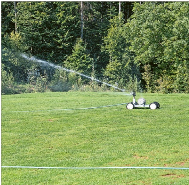
Bewässerung Golfplatz im Kanton Schwyz.

auf die Veränderungen einstellen. Grundsätzlich verfügt die Schweiz zwar über ausreichende Wasserreserven, nicht zuletzt dank der grossen Grundwasservorkommen. In Trockenperioden können bei kleineren lokalen Grundwasservorkommen und -quellen dennoch Engpässe auftreten.