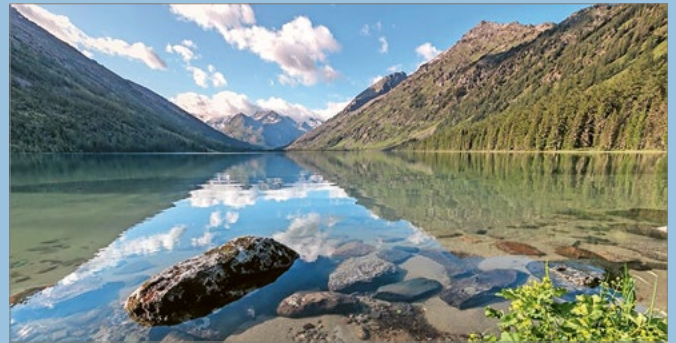
Die Schweiz ist ein wasserreiches Land.

Der Bundesrat hat an seiner Sitzung vom 18. Mai 2022 einen Bericht zur Wasserversorgungssicherheit verabschiedet. Angesichts des Klimawandels stellen sich Fragen, wie künftig die bestehenden Bedürfnisse am besten abgedeckt werden können. Der Bundesrat schlägt verschiedene Massnahmen vor.