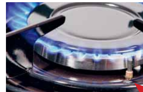
Cocina de gas con encendido de seguridad La flecha roja indica el termopar

Una cocina de gas dispone de encendido de seguridad, si para encenderla es necesario mantener apretado el botón de encendido durante unos 15 segundos y si dispone de un termopar (una barita de metal de aprox. 1 cm, véase imagen izquierda) en el quemador. El horno siempre dispone de encendido de seguridad.