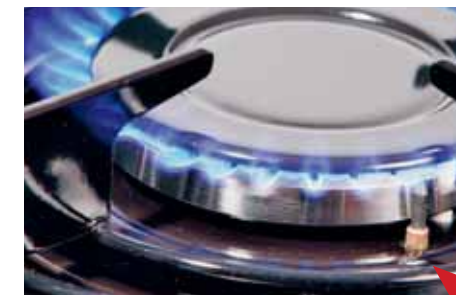
Fogão a gás com fusível de ignição A flecha vermelha aponta para o elemento térmico

É possível reconhecer fogões a gás quando o fogão não contém um elemento térmico (um pino de metal de aproximadamente 1 cm de comprimento, ver imagem à esquerda) ao lado do queimador e quando não é necessário pressionar o botão interruptor durante cerca de 15 segundos ao acender o fogo. O forno sempre possui fusível de ignição.