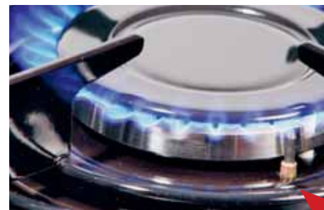
Cucina a gas con valvola di sicurezza La freccia rossa indica l'elemento della termocoppia

Le cucine a gas senza valvola di sicurezza sono riconoscibili perché durante l'accensione non è necessario tenere premuta la manopola per 15 secondi, e perché non è presente l'elemento della termocoppia (un perno di metallo lungo circa 1 cm, vedi fotografia a sinistra) accanto al bruciatore. Il forno è sempre dotato di valvola di sicurezza.