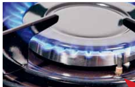
Gasherde mit Zündsicherung Der rote Pfeil zeigt auf das Thermo-Element

Nicht zündgesicherte Gasherde erkennt man daran, dass der Schalterknopf beim Anzünden nicht etwa 15 Sekunden gedrückt gehalten werden muss und dass sich kein Thermo-Element (ein etwa 1 cm langer Metallstift, siehe Abbildung unten) neben dem Brenner befindet. Der Backofen ist immer zündgesichert.