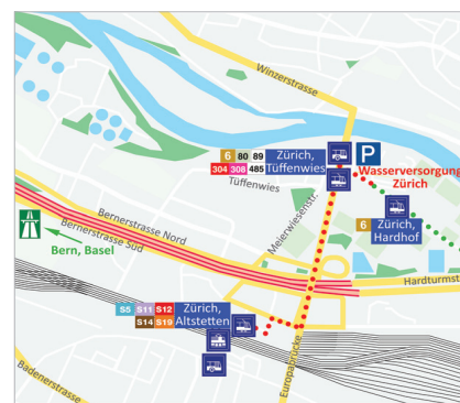
Situationsplan Wasserversorgung Zürich

Anreise mit ÖV Von Zürich HB mit Tram Nr. 6 Richtung «Werdhölzli» bis Haltestelle «Tüffenwies»; vom Bahnhof Altstetten mit Bus Nr. 80 Richtung «Bahnhof Oerlikon Nord» oder Nr. 89 Richtung «Heizenholz» bis «Tüffenwies».