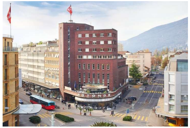
Maison du Peuple

Lieu Maison du Peuple Rue d'Aarberg 112, CH-2502 Bienne, Tél. +41 32 329 19 19 www.ctsbiel-bienne.ch